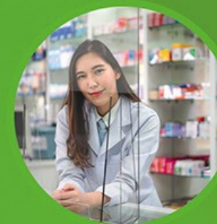
DIVISORIO ANTIBATTERICO DA BANCO in Plexiglass 5mm / 70x50 cm